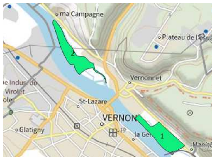
Zone 1 et 2 – Vernon